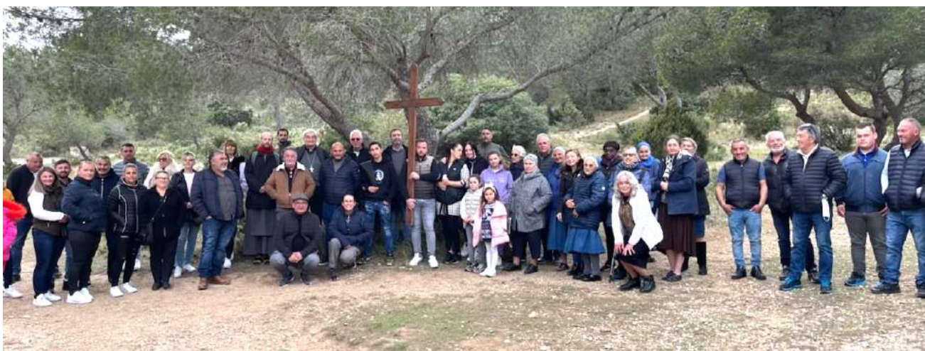
Photo prise à la fin du Chemin de Croix